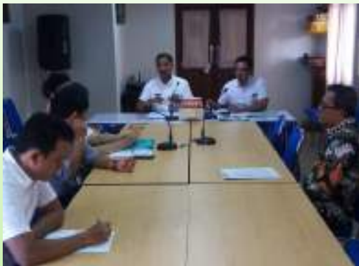
Kegiatan fasilitasi Penyelesaian Prosedur Penyelesaian Perselisihan Hubungan Industrial

Dalam upaya untuk mencapai sasaran Meningkatnya Perlindungan Tenaga Kerja dan Pengembangan Hubungan Industrial telah dilaksanakan Program Perlindungan Pengembangan