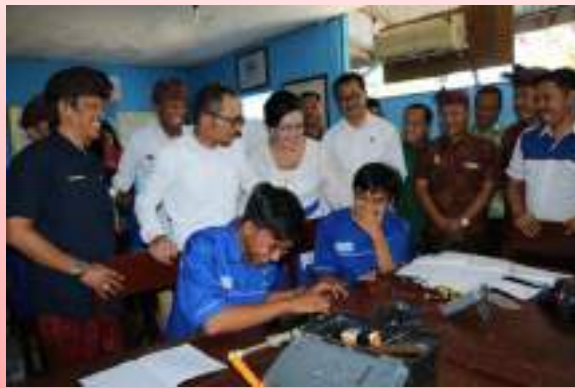
Kegiatan Pendidikan dan Pelatihan Teknik Pendingin AC

Dalam upaya untuk mencapai sasaran Meningkatnya Kompetensi Tenaga Kerja telah dilaksanakan Program Peningkatan Kualitas dan Produktivitas Tenaga Kerja dengan 5 Kegiatan Pendukung yang dapat digambarkan pada Tabel 3.2 dibawah ini :