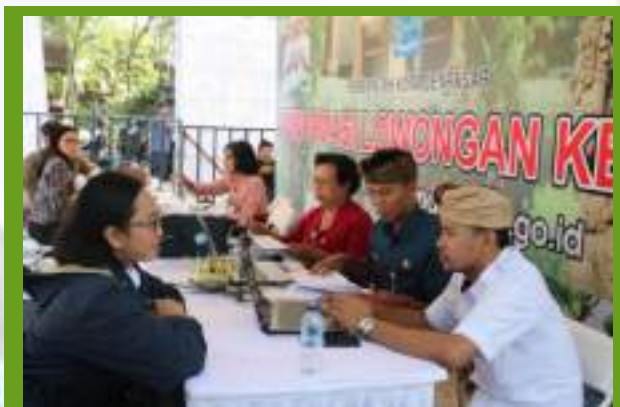
Kegiatan Fasilitas Ketenagakerjaan

Dinas Tenaga Kerja dan Sertifikasi Kompetensi Kota Denpasar sebagai perpanjangan tangan pemerintah dalam mengentaskan permasalahan ketenagakerjaan telah melakukan beberapa hal diantaranya menyediakan informasi yang seluas – luasnya bagi pencari kerja terkait kesempatan