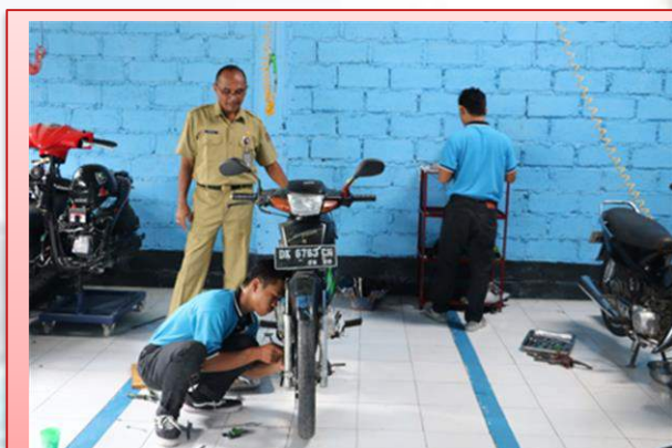
Kegiatan Pendidikan dan Pelatihan Teknik Perawatan Sepeda Motor

Pada Indikator Kinerja Persentase Tersalurnya Tenaga Kerja Yang Mengikuti Pelatihan, bertujuan untuk membentuk tenaga kerja yang terampil dan mandiri.